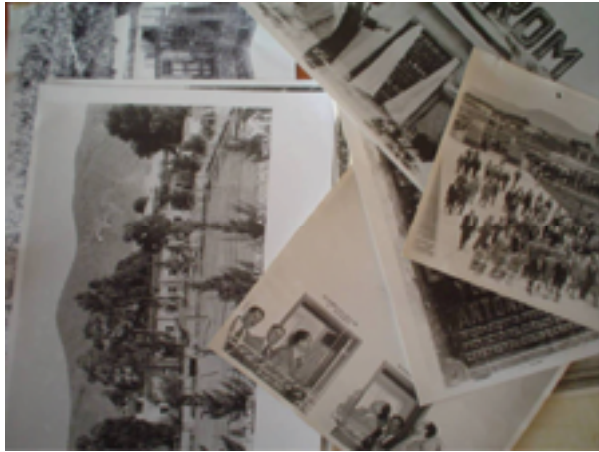
Antes del proceso