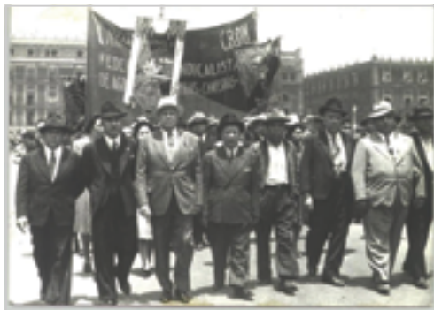
Luis N. Morones en un mitin en la ciudad de México.