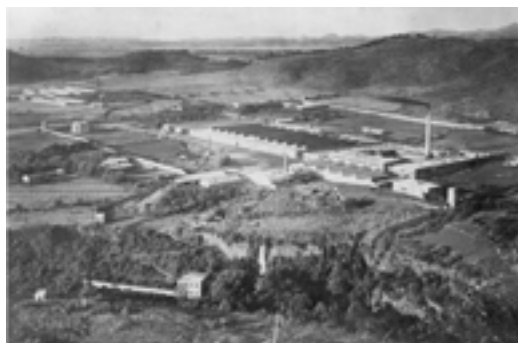
Fábrica de Metepec, Atlixco, Puebla

La fábrica de Metepec se instaló en las afueras de Atlixco (a 40 kilómetros de la ciudad de Puebla) y comenzó a funcionar en 1902. Ésta produjo una gran cantidad de telas, gracias a la pureza de las aguas de los manantiales de San Baltasar y del río Cantarranas, de cuyos productos se obtuvo un acabado de excelente calidad. Metepec fue la fábrica más grande de la región y la segunda en el país después de Río Blanco.